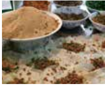
新竹飲食地標 郭家潤餅