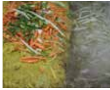
四代同堂捲潤餅 健民潤餅