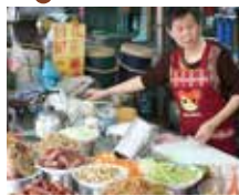
超級阿嬤的潤餅廚房 民族路林氏夫婦