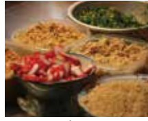
大稻埕的嚼勁 寧夏潤餅