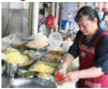
四面煎烤春捲 台南金得春捲