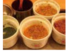
老圓環的古早味 萬福號潤餅