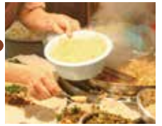
老食藝真功夫 龍江路王家