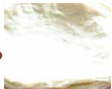
嘉義春味最香濃 黑松春餅